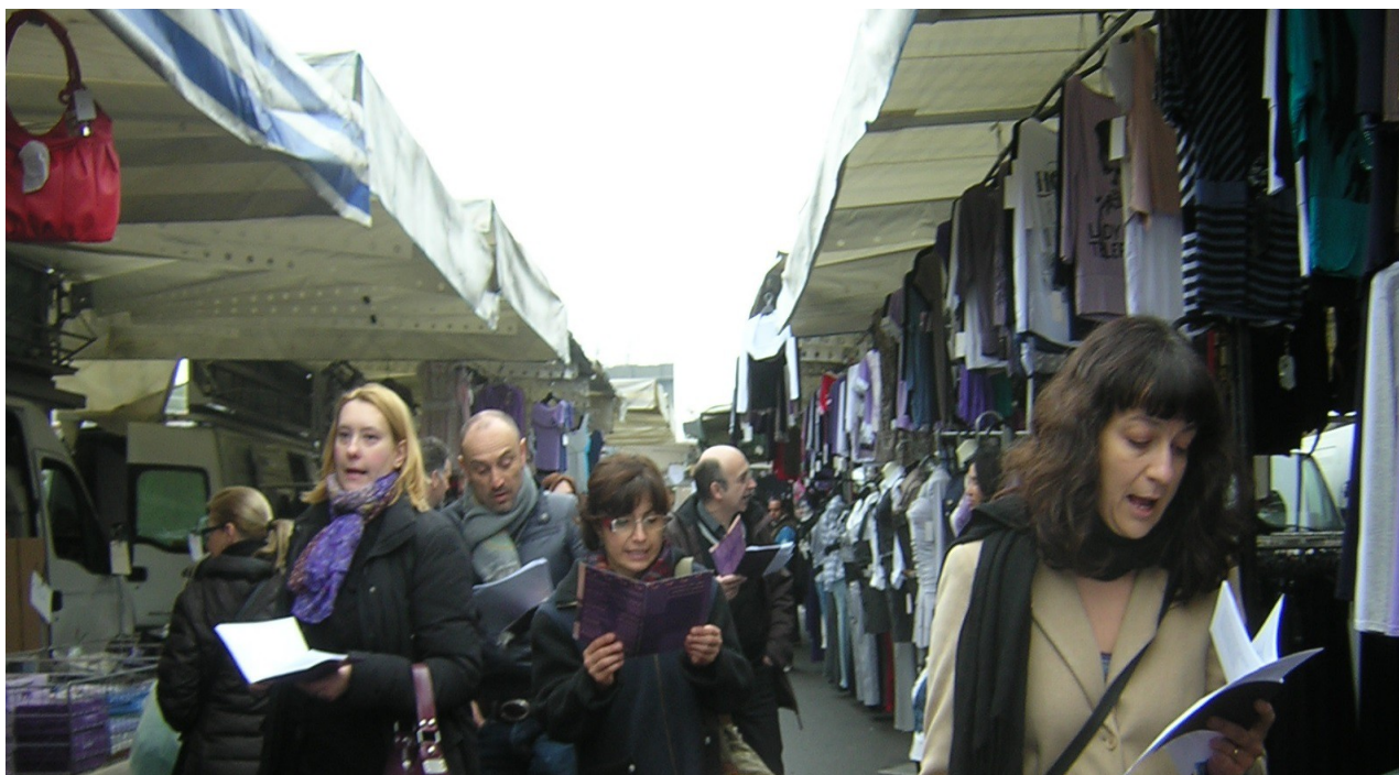
invasione del collettivo itinerante e corale "carovana dei versi - poesia in azione" al mercato di Varese (21.03.10)